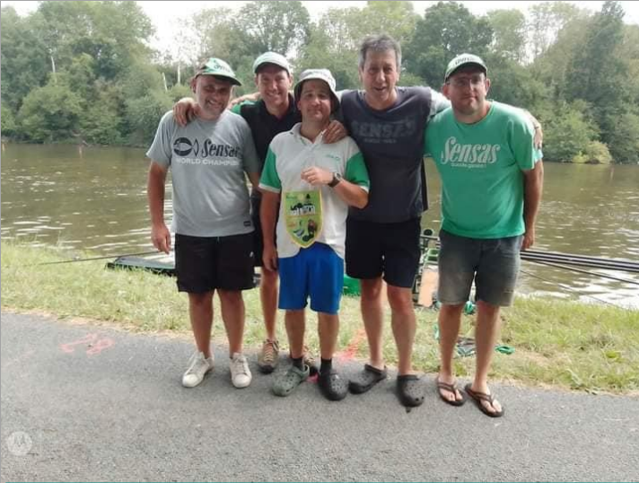
Team Sensas 87 15ème du championnat de France des Clubs 2023