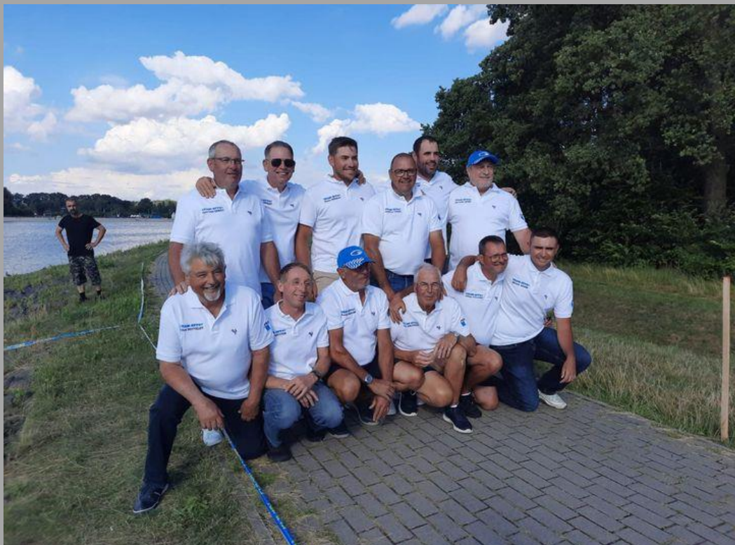
SPP87 8ème du championnat du monde des clubs