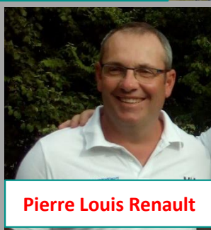
Pierre Louis Renault