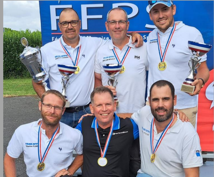
SPP87 Vainqueur du championnat de France des Clubs 2023