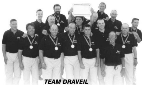
TEAM DRAVEIL Champion du monde des clubs

3000 carpe fine + 3000 Gialla + Aromix et graines. Cannes Roubaix et 3554