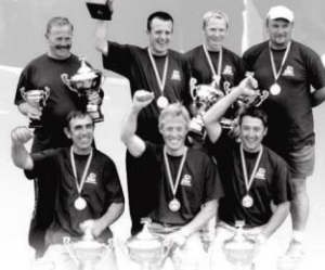
TEAM SENSAS ARTOIS Champion de France des clubs

Fond : 3000 étang + terre de Somme - Surface : Explosive étang + Tracix Cannes Sensas 3584 et 3554