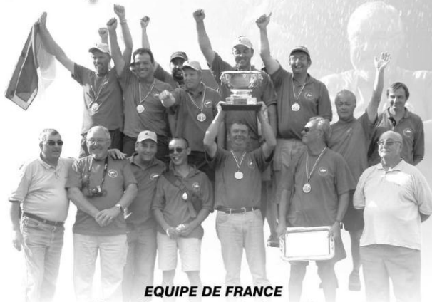
EQUIPE DE FRANCE Championne du monde des nations

3000 carpe fine + 3000 Gialla + Aromix et graines. Cannes Roubaix et 3554